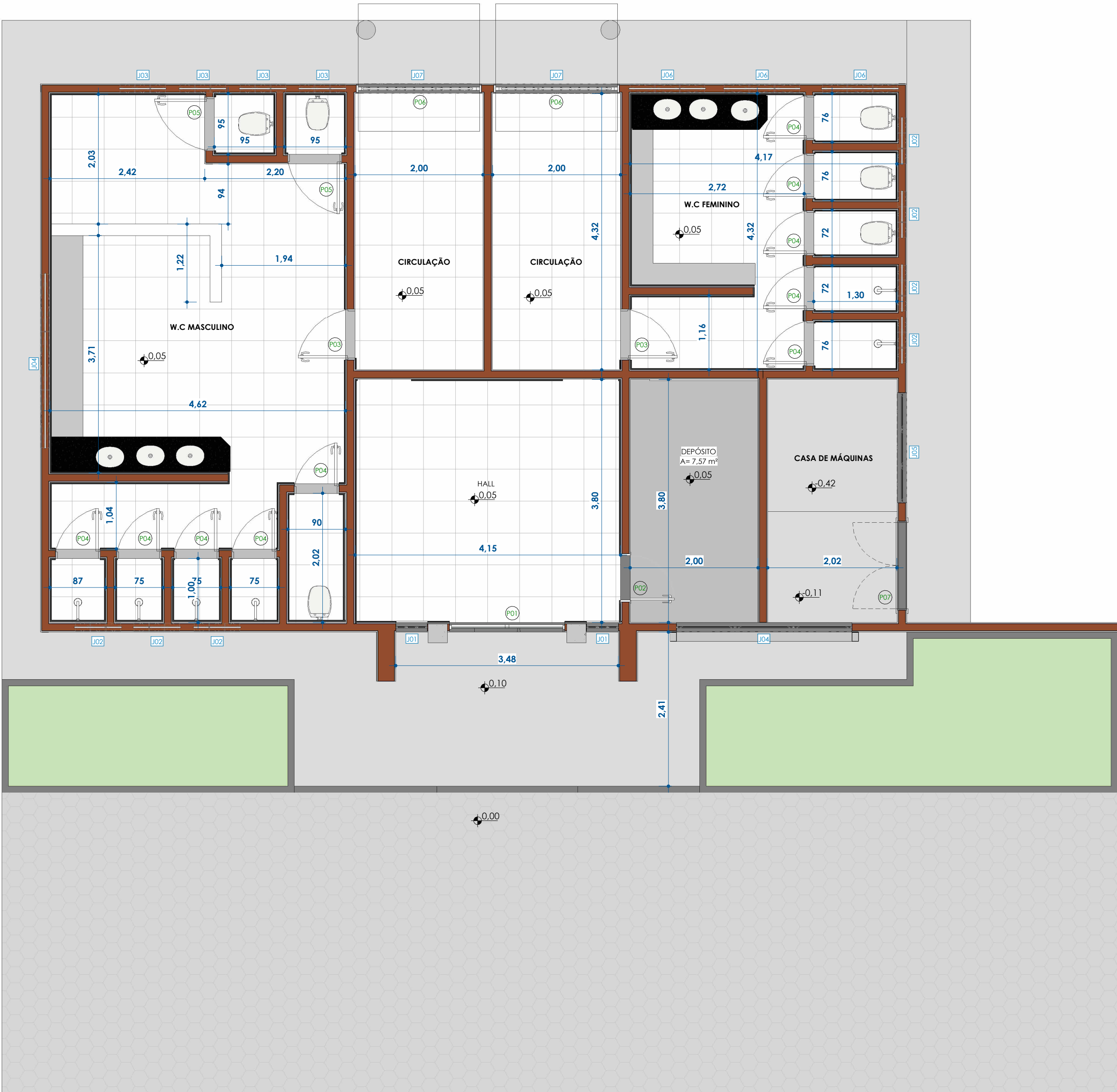
PLANTA BAIXA - EXISTENTE ESC: 1 : 50