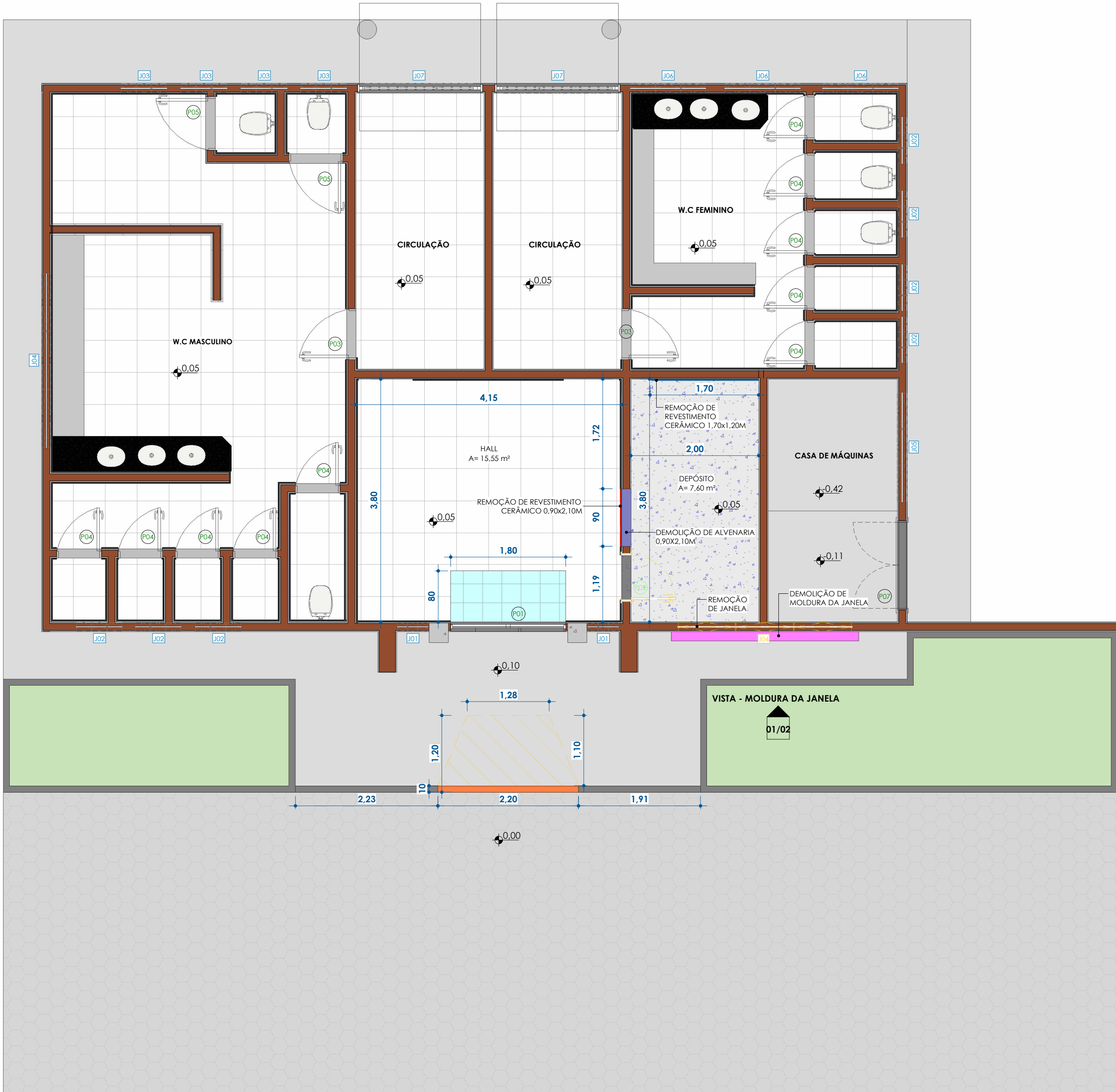
PLANTA BAIXA - DEMOLIÇÃO ESC: 1 : 50